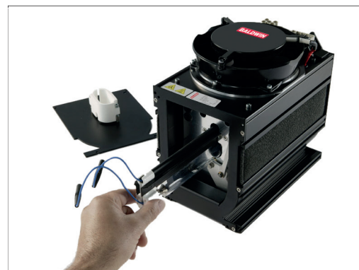
工具レスでランプ交換